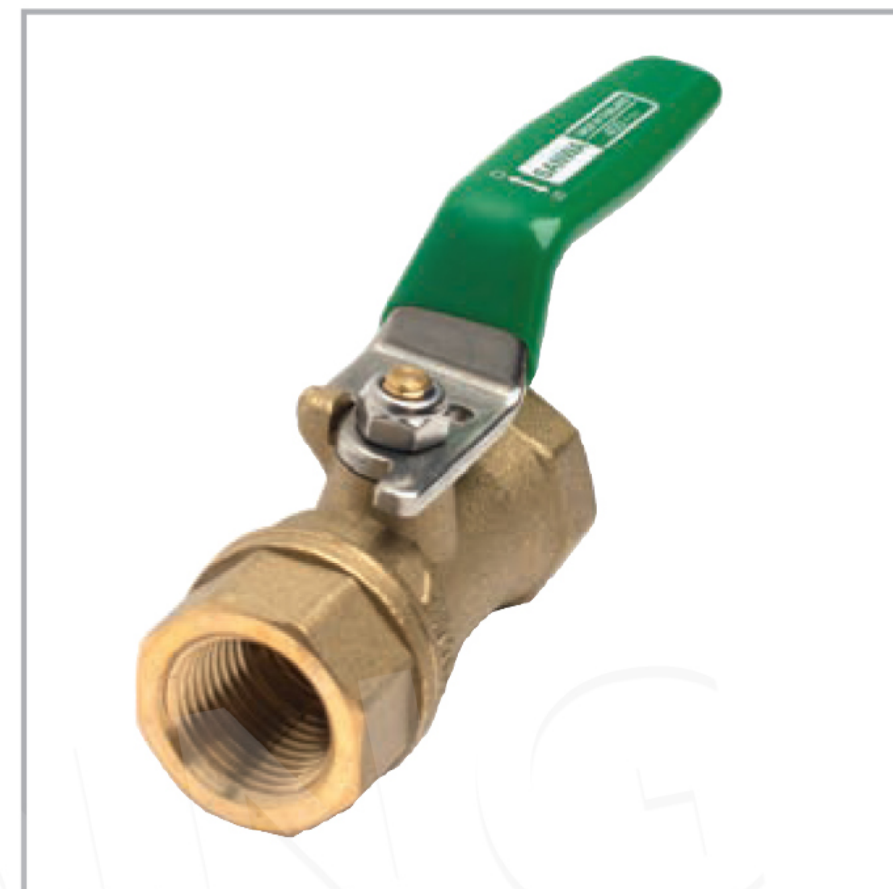
Dimension มิติ (mm.)